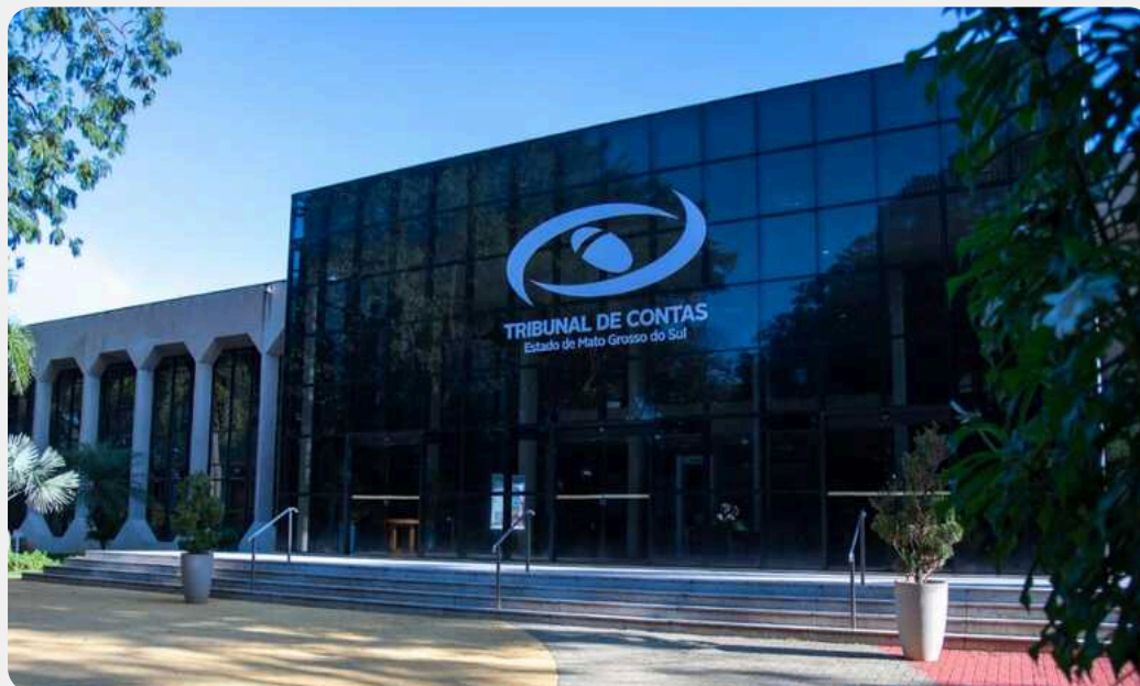
Sede do Tribunal de Contas de Mato Grosso do Sul - TCE/MS