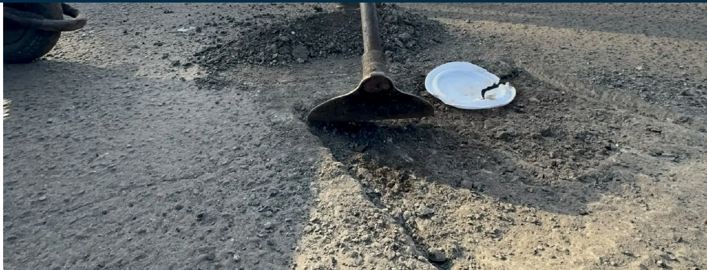
Recuperação do asfalto.